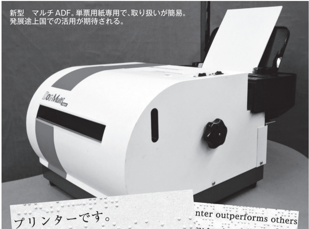
新型 マルチ ADF。単票用紙専用で、取り扱いが簡易。発展途上国での活用が期待される。

Printer outperforms others by simultaneously printing embosser and ink printer combining a built-in brailler and dot printer it enables alphabetic text printed in Braille. プリンターです。墨字もひらがな・カタカナは漢字かな混じり文書も印刷できますので、用途によって形態を変えることができます。